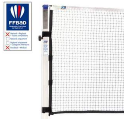
Filet de badminton GES compétition