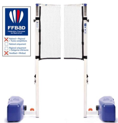
Poteaux GES "CR" toutes compétitions