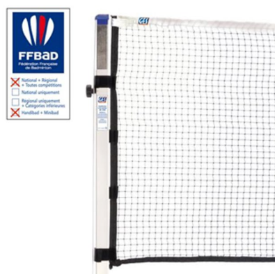
Filet de badminton GES compétition