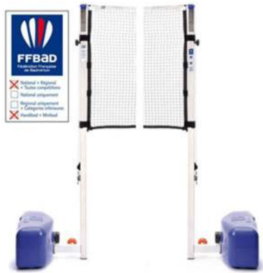
Poteaux GES "CR" toutes compétitions